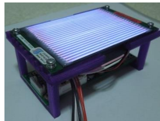
空冷機構付一体型モジュール