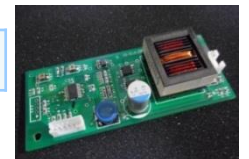
可変型インバータ